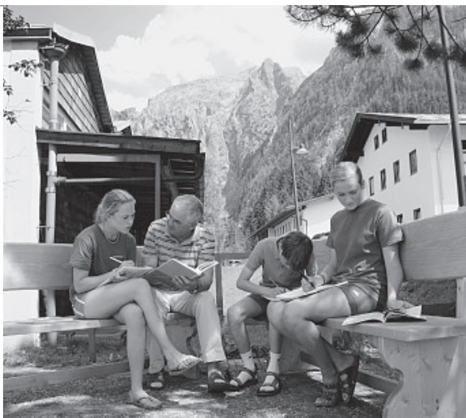
Im Sommer wird nachgeholt, was im Winter versäumt wurde: Schüler und Lehrer der Christophorusschulen am Dürreck