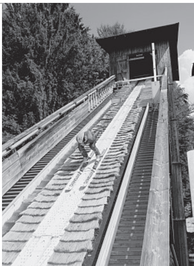
Sommerspringen auf Matten: Neben der Schule und mehr als 15 Stunden Training pro Woche bleibt den Sportlern kaum Freizeit

Und wie passen Sportler, Asthmatiker und Legastheniker an einer Schule zusammen? „Die Schule ist ein Abbild der Gesellschaft“, meint Schröder-Klementa. „Da leben die verschiedenen Gruppen auch zusammen.“ Vor allem aber gebe es zwischen Wintersportlern und Asthmapatienten eine Gemeinsamkeit: Beide versäumen wegen ihres „Handicaps“ oft den Unterricht. Wobei die Asthmatiker an der